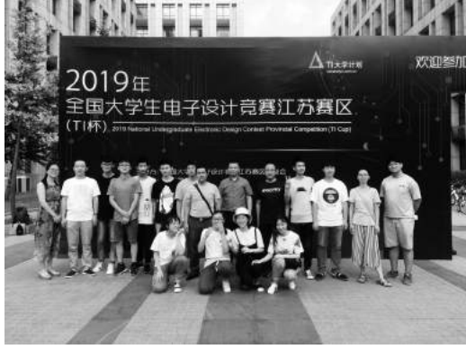
参加全国大学生电子设计竞赛是在校大学生一直向往的大赛。2019年暑假,对于电子系的一众师生而言,从7月11日到8月12日,满满的都是奋斗、忙碌、充实与挑战的日日夜夜,也是迎来丰收的日日夜夜。电子信息工程系的八位指导老师带领四组十二名同学,参加了2019IT杯全国大学生电子设计竞赛,三组作品获得了江苏赛区二等奖的好成绩。

积极响应国家现代学徒制试点和培养高职工匠精神的号召,以原有校企共建的工作室为平台,探索实施“三制融合”人才培养模式。一方面,我们为输送大量德才兼备的高技能应用型人才,得到了用人单位的广泛认可。另一方面,通过赛事检验教学成果。2019年,获得全国高等职业院校服装设计与工艺技能大赛三等奖。近三年来,获省教育厅主办的服装技能大赛、毕业设计评选等奖项共21项,其中银奖3项、二等奖3项、铜奖9项;优秀毕业设计二等奖1项、三等奖2项,省大创项目2项,优秀作品5项3项,无锡市技能竞赛一等奖1项,江阴市创新创业大赛一等奖1项。 今后,在校企合作深度融合的基础上,我们拟实现“培养一支队伍、搭建两个平台、推进三项改革、取得四类成果”,即培养具有国际视野、职称结构合理、社会服务能力强的一支专兼职教师队伍,搭建“校园服饰文化产学研平台”和“大学生创新创业平台”两大平台,继续推进“工艺单”教学改革、信息化教学改革和“三制融合”的工作室人才培养模式改革,同时在课程资源库建设、教材开发、设计研发中心建设、技能竞赛等方面取得进一步的成果。